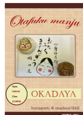
【 作成したポスター 】